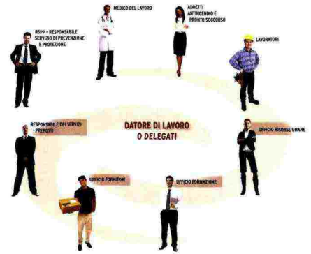
Schema di Safety Solution Zucchetti

Nel dettaglio l'applicazione consente di: redigere documenti come il DVR - Documento di Valutazione dei Rischi, il DSS - Documento di Sicurezza e Salute, il POS